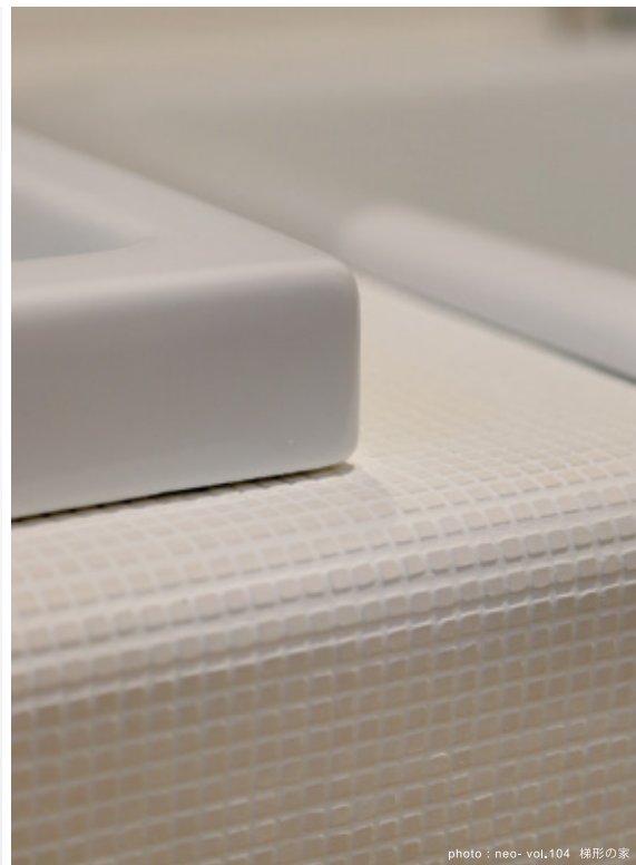
vol.104 梯形の家