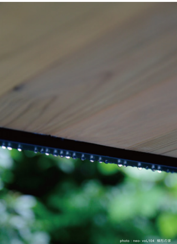
梯形の家