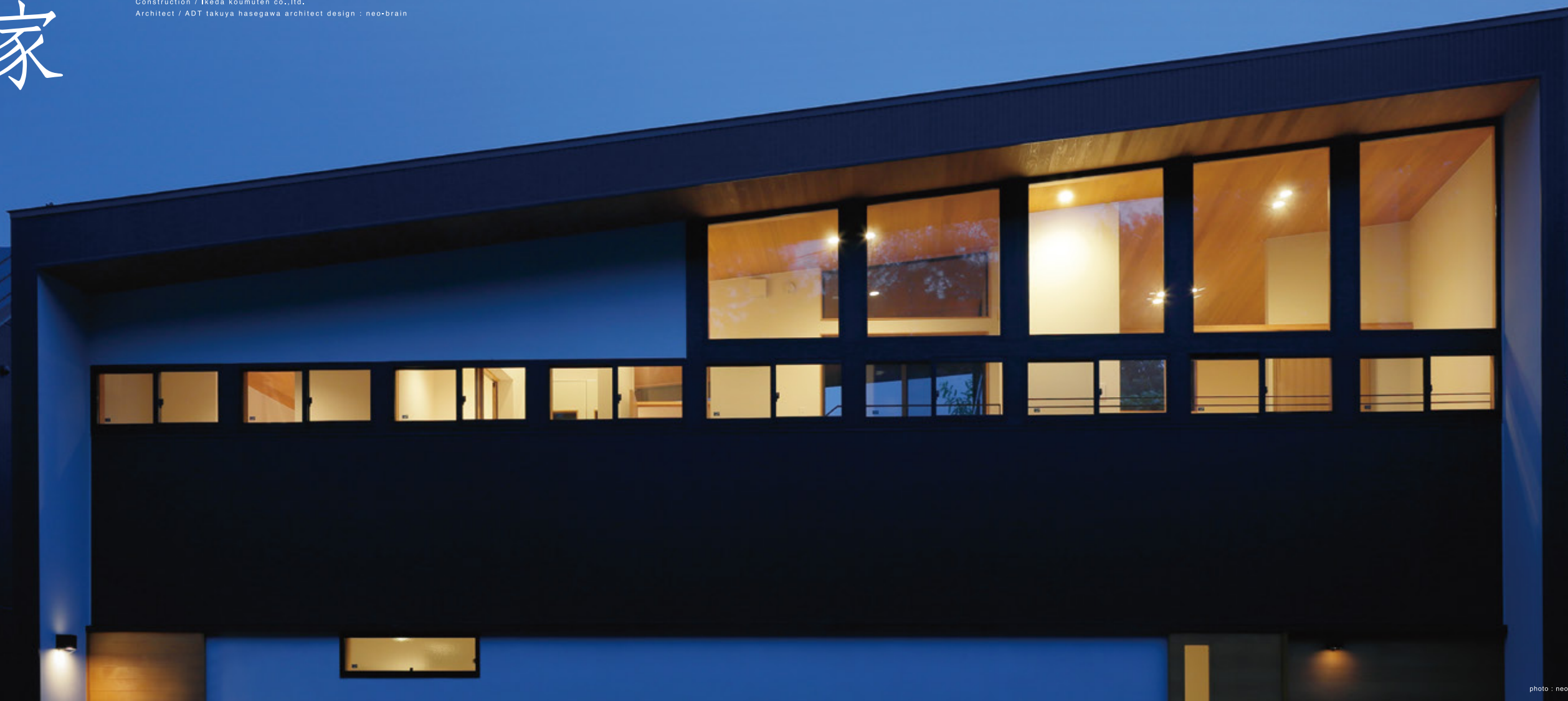
photo : neo- vol.104 梯形の家