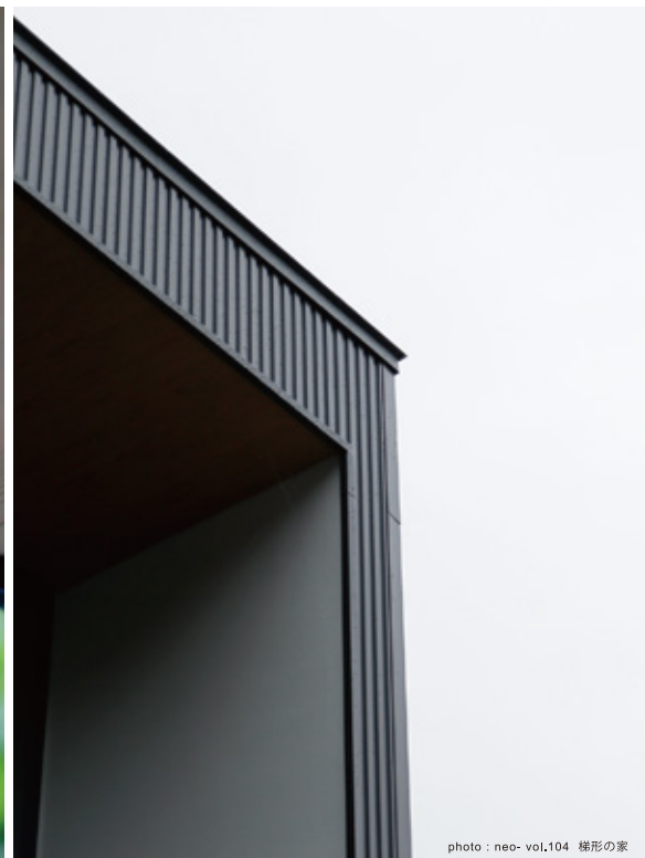
梯形の家