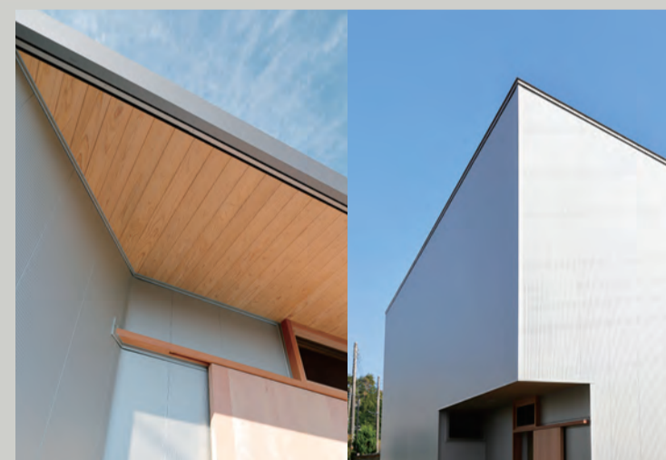
photo : neo-brain vol.107 step house