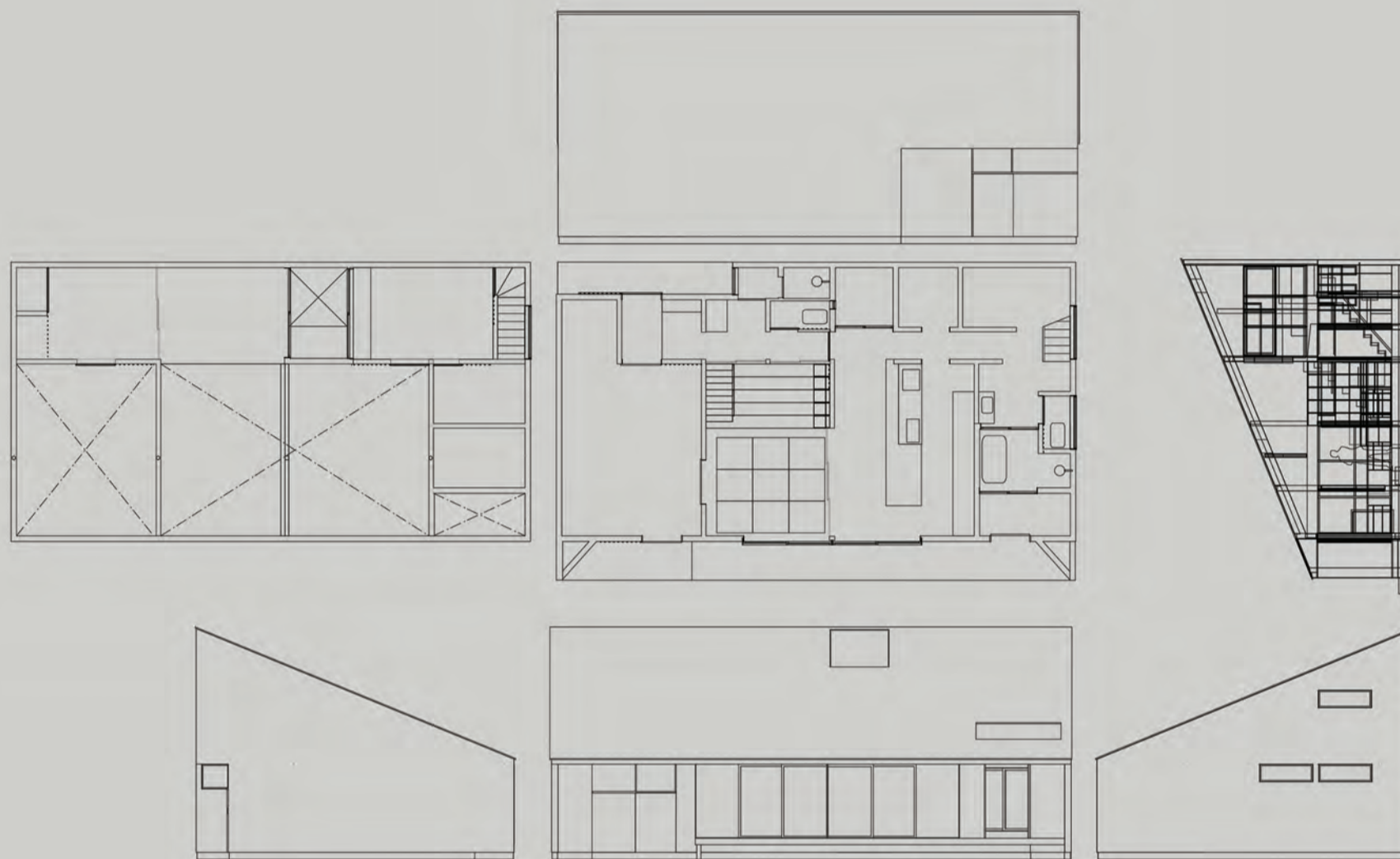
plan : neo-brain vol.107 step house

我々が大切にしているのは「対話」。 希望を叶える住宅を実現させるためには、まずお客様を知るところから。 建物は、できあがってからお客様との生活のスタートです。そこでどんな生活を送るのか、 家族がどんな成長をしていくのか。まずは何でもお話しください。そして一緒に考えましょう。